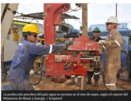
La producción petrolera del país sigue en ascenso en el mes de mayo, según el reporte del Ministerio de Minas y Energía.

Producción comercial de gas ha crecido 10% en lo corrido del año, en comparación con el mismo periodo de 2018