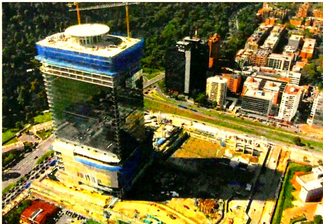
Aspectos del proyecto América Centro de Negocios, en Bogotá.

La gerencia de Aldea Proyectos, que administra y promueve América Centro de Negocios, de la calle 100 con carrera séptima en Bogotá, dijo que el plazo máximo de culminación es en mayo del 2024. Sin embargo, la primera entrega prevista para julio de este año no sería posible. Pág. 4