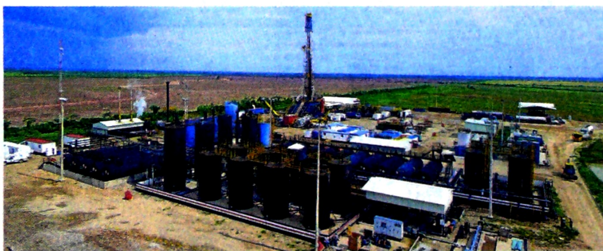
La petrolera tiene como meta estratégica desarrollar de manera más eficiente el bloque Llanos 34 (foto) en el 2019.

sarrollando en el territorio colombiano.