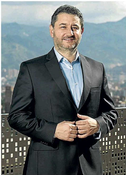
Alcaldía de Medellín