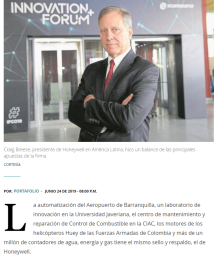
Craig Breese, presidente de Honeywell en América Latina, hizo un balance de las principales apuestas de la firma.