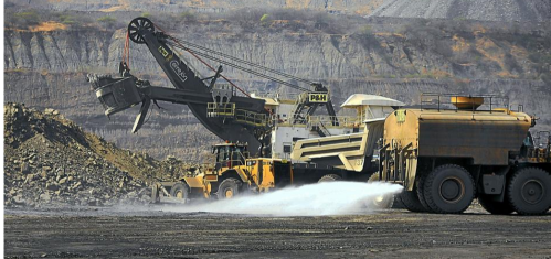
La extracción de carbón es uno de los grandes generadores de regalías.

RELACIONADOS: PLANEACIÓN NACIONAL | REGALÍAS | CONTRALORÍA GENERAL DE LA REPÚBLICA