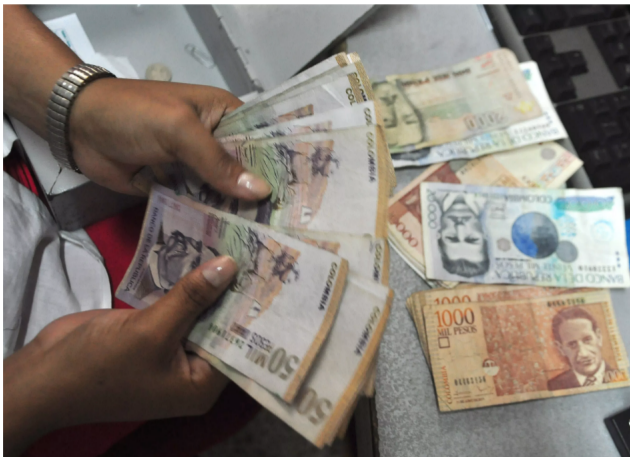
Este proyecto plantea aumentar de 11 % al 25 % los recursos de regalías.

Al proyecto le falta una segunda vuelta, por lo que se prevé que las regiones productoras recibirán un 25 % más de lo que actualmente reciben.