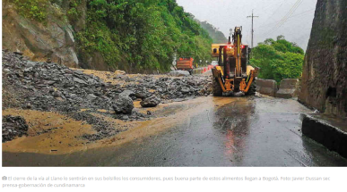
El cierre de la vía al Llano lo sentirán en sus bolsillos los consumidores, pues buena parte de estos alimentos llegan a Bogotá.

Las autoridades regionales insisten en una emergencia económica para solucionar la crisis por el cierre. Pero el Gobierno tendrá que sopesar muy bien el impacto fiscal de esta decisión.