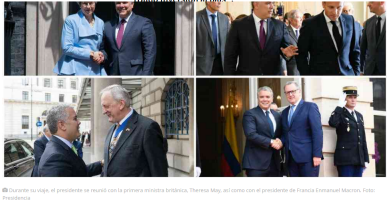
Durante su viaje, el presidente se reunió con la primera ministra británica, Theresa May, así como con el presidente de Francia Emmanuel Macron.

"Creo que estos viajes han traído inversión al país".