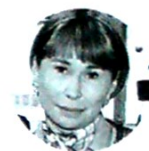
Alicia Arango Ministra de Trabajo

"Para mí es un placer anunciar inversiones por parte del Departamento de Negocios, Energía y Estrategia Industrial (Beis) para respaldar proyectos este año".