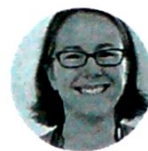
Harriet Wallace Funcionaria del Beis de Reino Unido

en una industria verde, compartiendo la experiencia de la City de Londres (área central de la capital británica), e introduciendo vehículos de bajas emisiones en las principales ciudades de Colombia", dijo Duque. Más allá de estos recursos, el Presidente expuso a Colombia como "un país seguro para los capitales" ante cientos de empresarios y banqueros, hecho