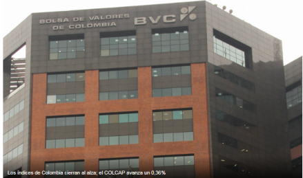
Los índices de Colombia cierran al alza; el COLCAP avanza un 0,36%

Investing.com – La Bolsa de Colombia cerró con avances este viernes; las ganancias de los sectores industria, agricultura, y finanzas impulsaron a los índices al alza.