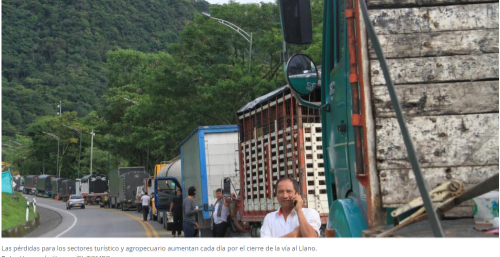
Las pérdidas para los sectores turístico y agropecuario aumentan cada día por el cierre de la vía al Llano.

RELACIONADOS: META | VILLAVICENCIO | VÍA AL LLANO