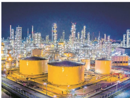
Los precios del petróleo escalan este jueves más de un 4%, para ubicarse por encima de 63 dólares el barril.