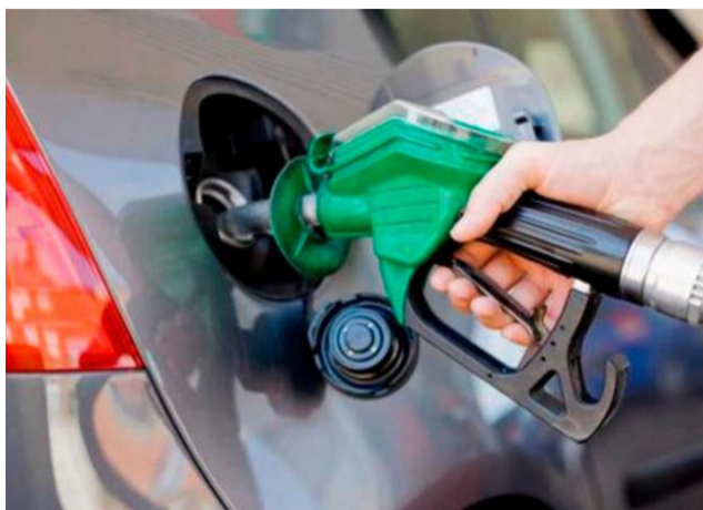
Foto: Gasolina

La jefe de la cartera también aseguró que la afectación en el poliducto no debería tener consecuencias en el precio.