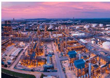
Blu Radio. Reficar.

Inicialmente, la ampliación de la refinería se estimó que valdría 3.700 millones de dólares, pero al final terminó costando 8.016 millones de dólares.