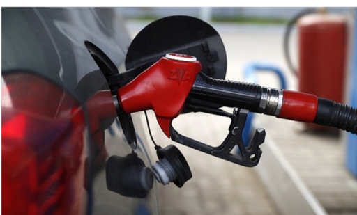
Venezuela se quedará sin gasolina en un mes, afirman trabajadores petroleros.

El Ministerio de Minas y Energía aseguró que ha adoptado medidas para dar continuidad al abastecimiento de combustibles en la región, sin afectar el precio de venta al consumidor