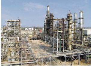
Refinería de Cartagena, Reficar

Recommend 0 Share junio 19, 2019 12:25 pm