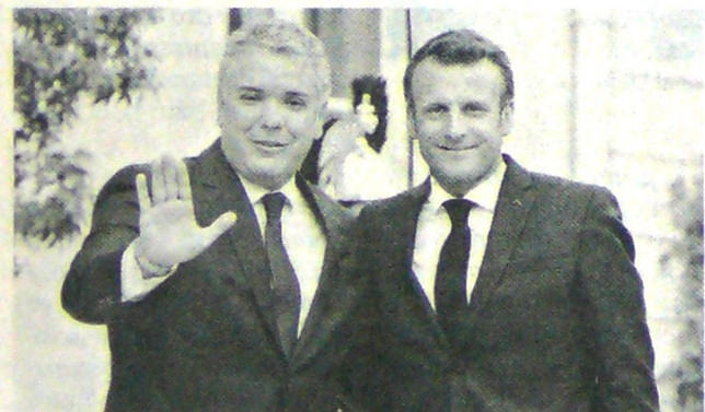
El presidente francés, Emmanuel Macron (d), recibe a su homólogo colombiano, Iván Duque (i), en el Palacio del Elíseo.