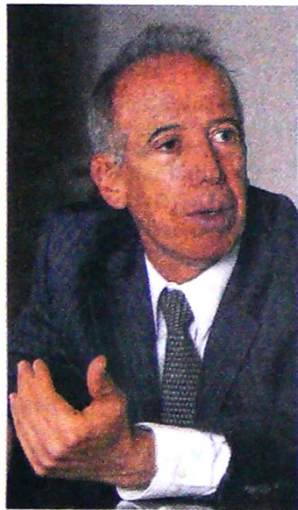
Sergio Clavijo Presidente de Anif.

El Gobierno incluyó dentro de su balance de ingresos las utilidades del Banco de la República y los recursos por privatizaciones, que llegarían a unos $8 billones en el 2019. Expertos calificaron el cambio como 'exótico y poco ortodoxo'. Pág. 8