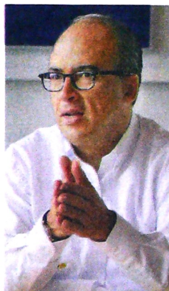
Juan Carlos Echeverry Exministro de Hacienda.