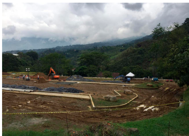
BLU Radio. Servicio de gas en norte del Valle de Aburrá podría afectarse tras deslizamiento

La autorización se dio con el fin de evitar escasez de combustible en Antioquia y el suroccidente del país.