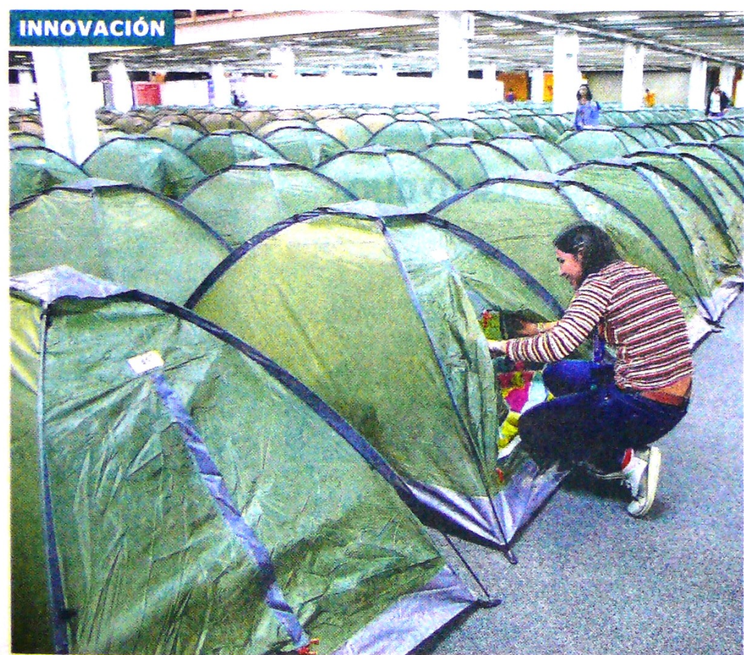
Hay espacio hasta para albergar a quienes no quieren perderse un solo detalle del evento.

El exministro de Hacienda, Juan Carlos Echeverry, señala que es necesario hacer apuestas concretas en actividades distintas como el 'fracking' y el cannabis. Pág. 8