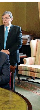
Colombia y el Reino Unido firmaron un acuerdo de cooperación en materia de cambio climático.

NOELIA CIGÜENZA RIAÑO nciguenza@larepublica.com.co