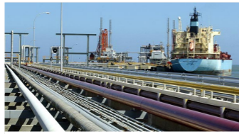
Siete empresas petroleras buscan destino para operar en Colombia.

Home / Actualidad / Siete empresas buscan participar en contratos petroleros en Colombia