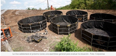
La USO adelantará el próximo lunes una asamblea general para evaluar la situación.

Desde ya la USO anuncia asamblea general y circular ante el Ministerio del Trabajo por violación de los derechos colectivos de los trabajadores.