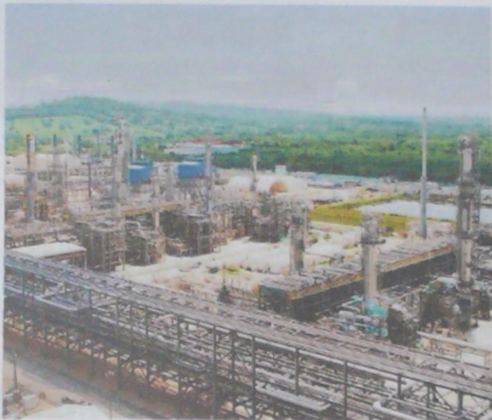
ARCHIVO - EL NUEVO Día Dos expresidentes de Reficar, fueron imputados por parte de la Fiscalía por ser los presuntos responsables de anomalías.

Según trascendió, el contrato está relacionado con el proyecto