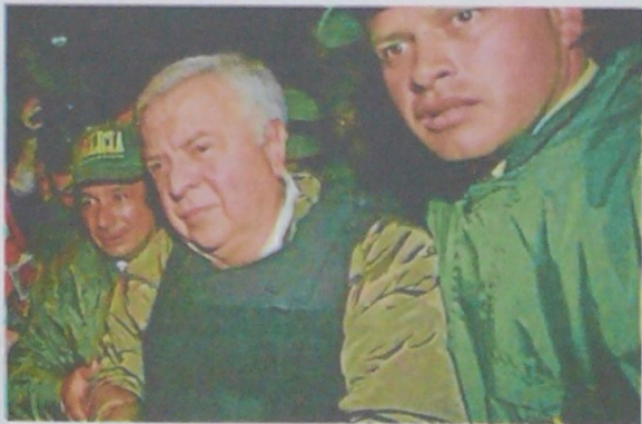
Gilberto Rodríguez Orejuela.