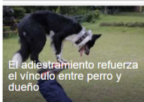
El adiestramiento refuerza el vínculo entre perro y dueño