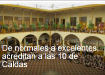
De normales a excelentes, acreditan a las 10 de Caldas