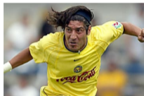
[Galería] Futbolistas famosos que hoy son pobres