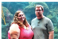
Recién casados hacen una apuesta de pérdida de peso. 18 meses después se ven como súper modelos