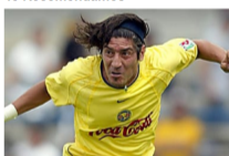
[Galería] Futbolistas famosos que hoy son pobres