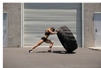
Todos los tips para un cuerpo ideal, sin ejercicio excesivo. Mi mejor compañero. Descubre cual es