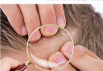
Sabemos cómo recuperar el cabello perdido sin cirugías. Encuéntralo aquí.