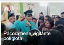
Pácora tiene vigilante políglota