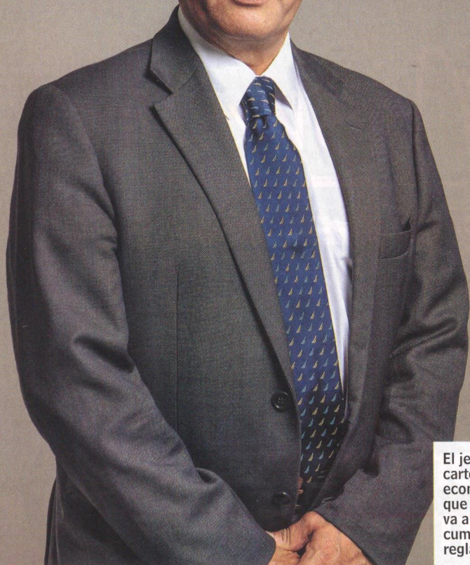
Alberto Carrasquilla Ministro de Hacienda

El jefe de la cartera de economía cree que este año va a sobre cumplir la regla fiscal.