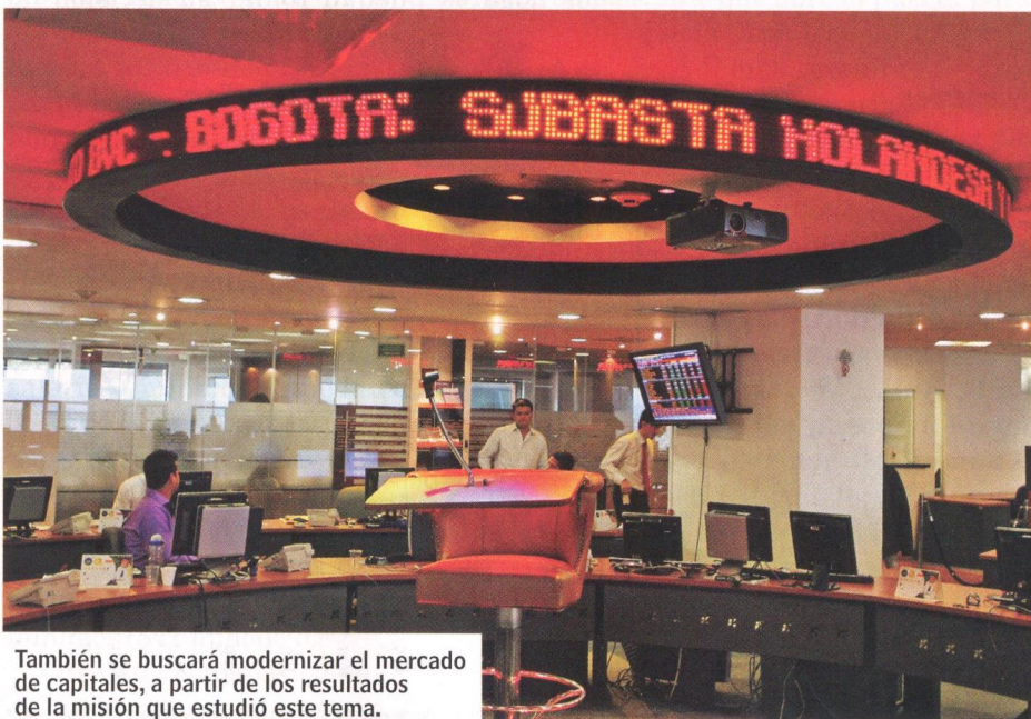
También se buscará modernizar el mercado de capitales, a partir de los resultados de la misión que estudió este tema.