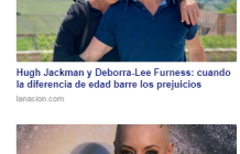
Hugh Jackman y Deborah-Lee Furness: cuando la diferencia de edad barre los prejuicios