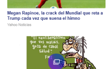
Así es como la 4T 'mató' al neoliberalismo