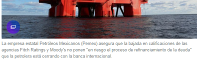
La empresa estatal Petróleos Mexicanos (Pemex) asegura que la bajada en calificaciones de las agencias Fitch Ratings y Moody's no ponen "en riesgo el proceso de refinanciamiento de la deuda" que la petrolera está cerrando con la banca internacional.

Incluso la baja en la calificación de Pemex tuvo un efecto en cadena, pues contribuyó a que la última Fitch recortara la nota de deuda soberana de México a largo plazo, "al ver mayor riesgo para el país".