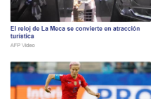
Megan Rapinoe, la crack del Mundial que reta a Trump cada vez que suena el himno