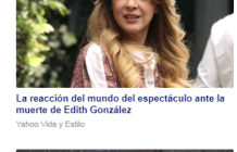
La reacción del mundo del espectáculo ante la muerte de Edith González