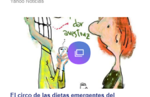
El circo de las dietas emergentes del 'socialismo'