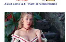
Un 'corazón salvaje': los papeles más simbólicos de Edith González