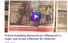
Policía brasileña denuncia por difamación a mujer que acusa a Neymar de violación