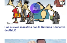
Los nuevos maestros con la Reforma Educativa de AMLO