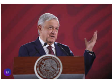
El presidente de México, Andrés Manuel López Obrador.