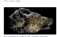
Encuentran la cabeza de un lobo gigante prehistórico en magnífico estado de conservación