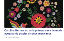
Carolina Herrera no es la primera casa de moda acusada de plagiar diseños mexicanos