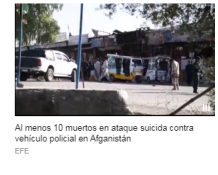
Al menos 10 muertos en ataque suicida contra vehículo policial en Afganistán