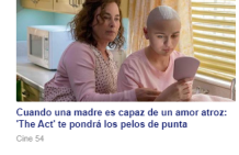
Cuando una madre es capaz de un amor atroz: 'The Act' te pondrá los pelos de punta