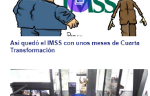
El reloj de La Meca se convierte en atracción turística