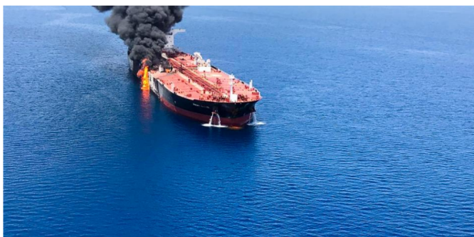
Los barcos fueron atacados en el golfo de Omán.