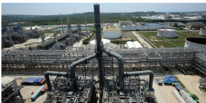
La refinería Reficar de Cartagena.