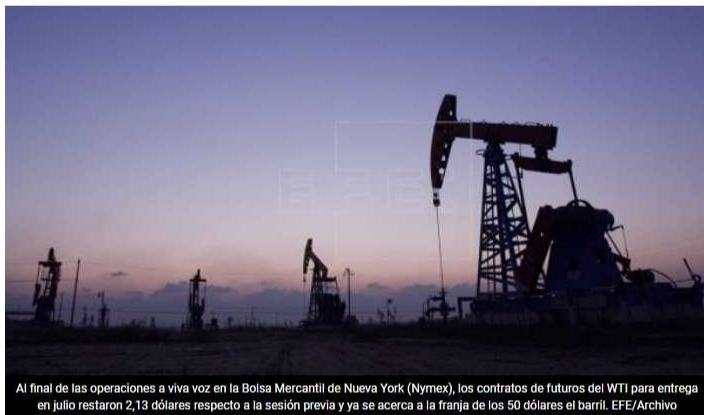
Al final de las operaciones a viva voz en la Bolsa Mercantil de Nueva York (Nymex), los contratos de futuros del WTI para entrega en julio restaron 2,13 dólares respecto a la sesión previa y ya se acerca a la franja de los 50 dólares el barril.