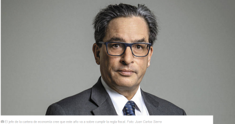
El jefe de la cartera de economía cree que este año va a sobre cumplir la regla fiscal.

El ministro de Hacienda apuesta por un crecimiento de 3,6% para 2019 y un déficit fiscal que sobre cumpla la regla fiscal. ¿Por qué su optimismo?