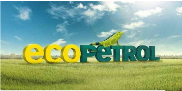
Ecopetrol financiará el Canal del Dique?

Recuperar la navegabilidad del Canal del Dique constituye uno de los proyectos emblemáticos de infraestructura. El valor puede superar $1,5 billones y el Gobierno busca los recursos. Entre otras fórmulas, existe la posibilidad de que Ecopetrol financie esa megaobra por medio de mecanismos como el de obras por impuestos. Sin embargo, hay que hacer el ejercicio financiero a plazos muy amplios – más de 10 años – porque de lo contrario podría afectar el recaudo.