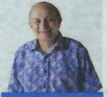
Gustavo Álvarez Gardeazábal