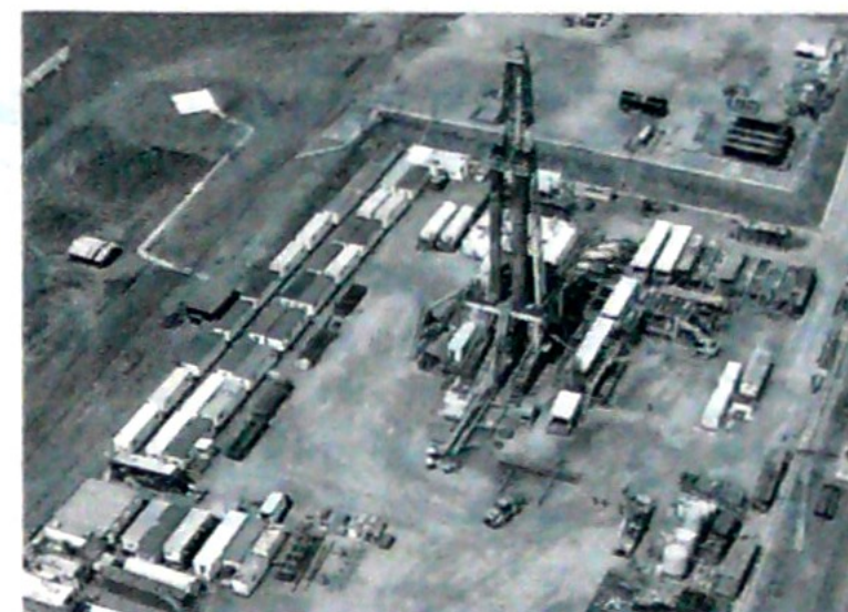
La plataforma luego se trasladará al pozo Andina-3.

Sobre la oferta, el ministro de Energía de Arabia Saudita, Khalid al-Falih, dijo que Rusia era el único exportador de petróleo que no ha decidido si extender el acuerdo de recorte al bombeo que pactaron grandes productores. Ambos temas le seguirían pasando factura a la incertidumbre y los mercados, por lo menos en lo que queda de la semana. ☺