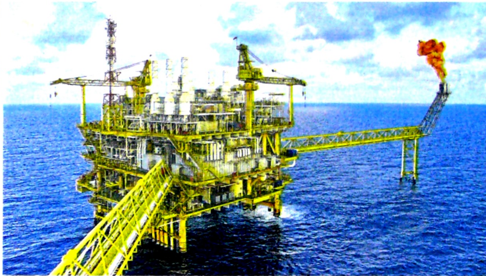
El foco de la operación de Noble Energy en Colombia será el desarrollo de bloques costa afuera, en el mar Caribe.

Morelli ha recalorado en diferentes escenarios al respecto que, la PPAA le da la oportunidad a aquellas em-