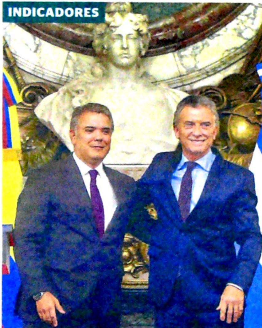
El presidente Iván Duque fue recibido ayer en Buenos Aires por Mauricio Macri, su homólogo de Argentina.