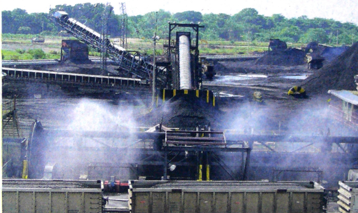
La caída del precio afecta los costos de operación, que sumado al pago regalías a la Nación, lleva a recortes en la operación. CEET