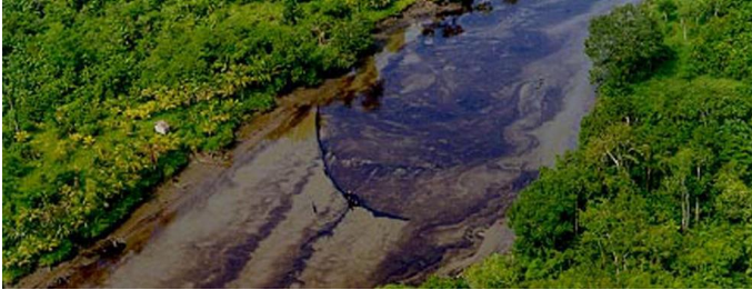
"El ataque produjo rotura de la tubería y derrame de crudo en el suelo y en la capa vegetal. Parte del hidrocarburo quedó contenido en el cráter que dejó la explosión", dijo Ecopetrol en un comunicado.

El atentado, el número 18 en lo que va del año, se registró en zona rural del municipio de Saravena, en el nororiental departamento de Arauca, fronterizo con Venezuela.