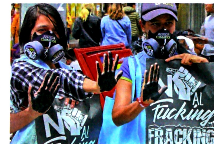
Manifestantes protestaron ayer, mientras se realizaba la audiencia del Consejo de Estado, contra el uso del 'fracking' en Colombia.

La demanda está en el Consejo de Estado, que ayer decretó varias pruebas para alimentar el estudio del caso. Quizás la más impor-