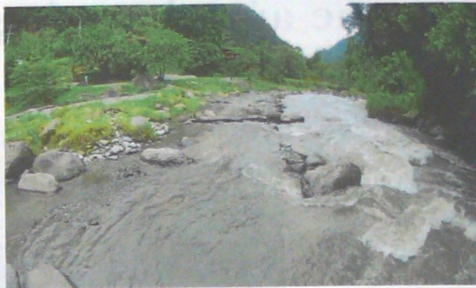
Tres empresas contaban con concesiones de títulos mineros en la cuenca de estos afluentes.

El Tribunal Administrativo del Tolima cesó definitivamente la exploración y explotación en las cuencas de tres afluentes de la ciudad, luego de una acción popular de la Personería en 2011.