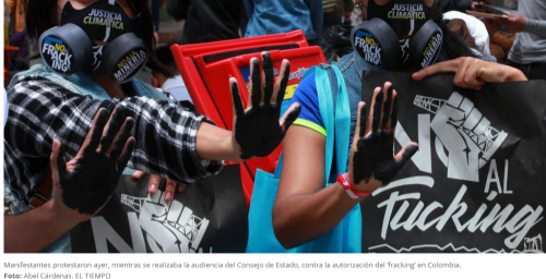
Manifestantes protestaron ayer, mientras se realizaba la audiencia del Consejo de Estado, contra la autorización del fracking en Colombia.

RELACIONADOS: CONSEJO DE ESTADO | MINISTERIO DE MINAS Y ENERGÍA | ECDPETROL | HIDROCARBUROS | EXPLOTACIÓN PETROLERA