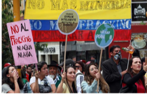
Manifestantes protestaron ayer, mientras se realizaba la audiencia del Consejo de Estado, contra la autorización del fracking en Colombia.

Además de este informe, el Consejo de Estado decretó como pruebas informes de la Contraloría, varios libros y estudios sobre fracking , la exposición de motivos del proyecto de ley del Senado que busca prohibir esa técnica en Colombia y testimonios de expertos en geología, salud e ingeniería.