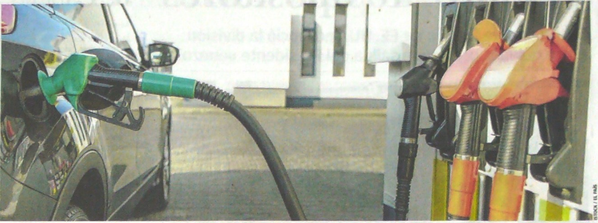
En el país hay 6500 estaciones de gasolina y en Cali 160. La labor de la SIC es visitar estos establecimientos y confirmar que los medidores estén bien calibrados