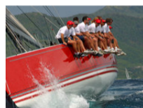
A Drop in Yield... ETF Global