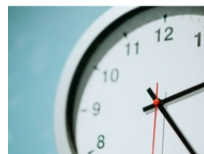
A perfect pension? The AIC