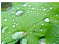
Growing popularity of Environmental, Social & Governance investing The AIC