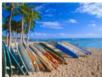
Riding the waves The AIC