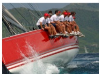
Trading Bumps ETF Global