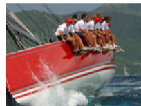
Trading Bumps ETF Global