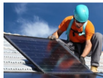
Latin America's Renewable Riches LaAM INVESTOR