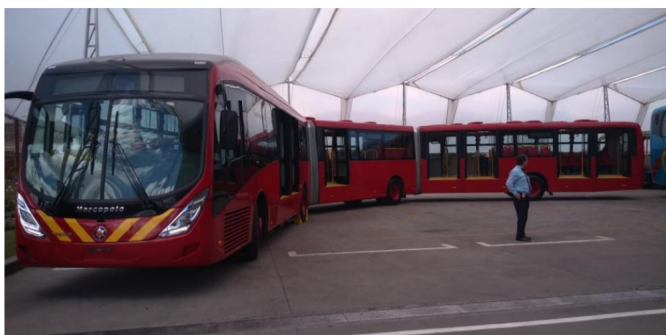
Así se ven los nuevos buses que ingresarán al sistema desde el 16 de junio próximo.

RELACIONADOS: TRANSMILENIO | ECOPETROL | CALIDAD DEL AIRE