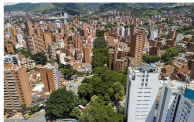
La ciudad consolidó el segundo conglomerado público del país con activos por $82 billones. Panorámica del occidente de Medellín.

ALCALDÍA DE MEDELLÍN | ECONOMÍA | EMPRESAS | EMPRESAS ANTIOQUEÑAS | POLÍTICA SECTORES ECONÓMICOS