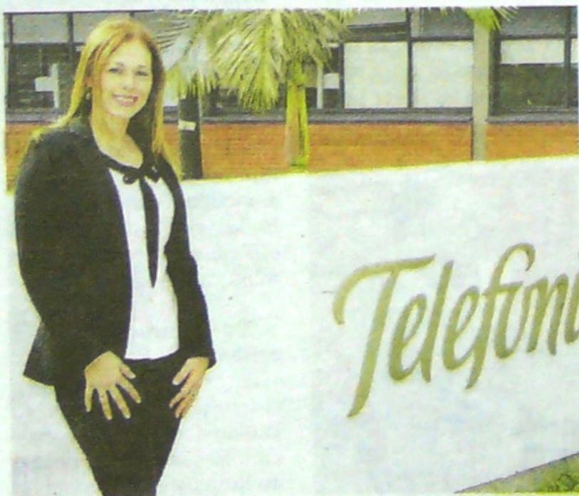
Gandur es ingeniera industrial egresada de la Universidad Pontificia Bolivariana Seccional Bucaramanga con un destacado historial

Telefónica es uno de los mayores impulsores de la economía digital en el país, con ingresos por 5,0 billones de pesos en el 2017. La actividad de la compañía, que opera bajo la marca comercial Movistar,