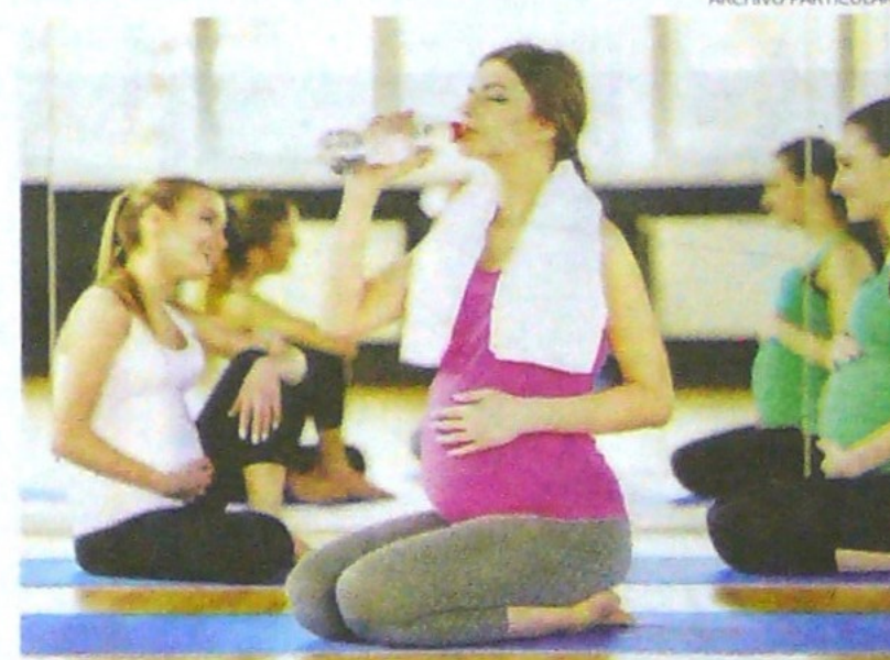
Entre los principales factores de la mortalidad materna están la falta de atención preconcepcional y la falta de controles al médico.

capacitando a los responsables del tema con el fin de fortalecer capacidades y habilidades en el talento humano y así mejorar la calidad de la atención de las mujeres gestantes en el departamento.