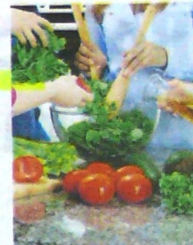
El objetivo es tener un equilibrio entre alimentos limpios y economía.

"Aquí tenemos los acuíferos superficiales a 400 metros, pero los yacimientos no convencionales en el valle medio del Magdalena están a 4.000 o 5.000 metros", manifestó Espinosa.