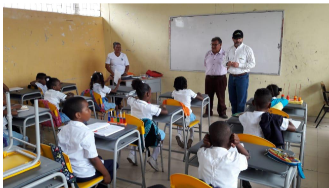
La entrega de dotaciones educativas que hizo Ecopetrol dentro del programa Obras por Impuestos constan de sillas, mesas, pupitres y tableros.

Entregó dotaciones que hacen parte del paquete de los nueve proyectos aprobados a Ecopetrol en la vigencia 2017, por un valor de $94 mil millones.