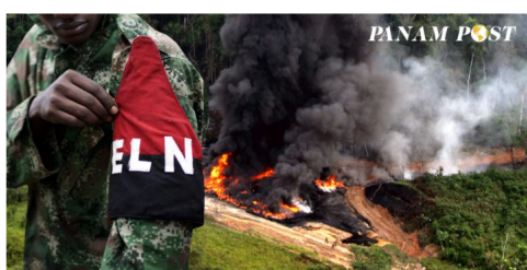
El ELN ha sido el grupo terrorista que más ataques ha lanzado contra la infraestructura petrolera.