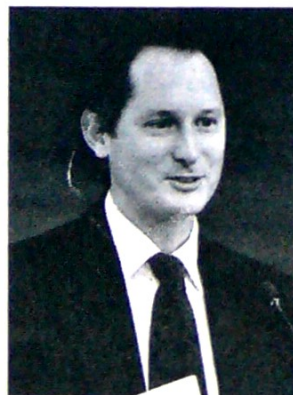
John Elkann, CEO de FCA.

Los directores de Renault no alcanzaron una resolución sobre la propuesta de fusión en una junta que se alargó hasta la noche de ayer. La junta fue “incapaz de tomar una decisión debido al requerimiento expreso por representantes del estado francés para posponer la votación para una reunión posterior”, explicó la