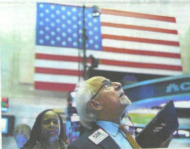
LA SUBIDA ARANCELARIA DE CHINA entró en vigor durante el fin de semana y los impuestos serían entre el 5 % y el 25 %, y se aplicarán a una lista de 5.410 productos.

La medida llegó tras una semana marcada por la escalada verbal entre China y Estados Unidos, en la que Pekín llegó a amenazar con restringir la exportación de tierras raras, un producto clave para la industria tecnológica estadounidense, después de que Trump incluyera en una lista negra al gigante de las telecomunicaciones Huawei.