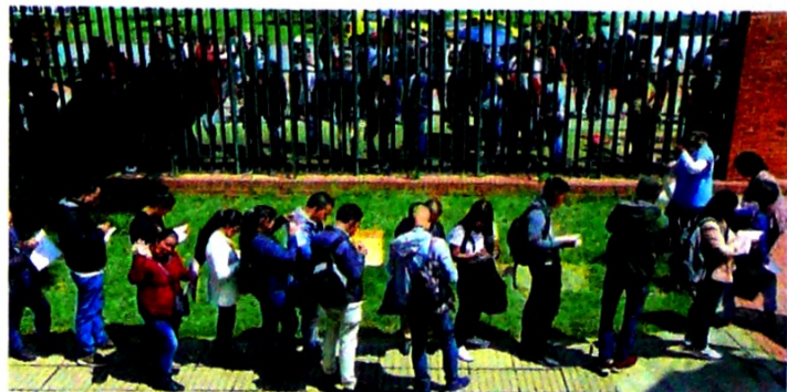
La política pública de empleo buscará la inclusión de mujeres, jóvenes y discapacitados que no entran fácil al mercado laboral.

Arango enfatizó en que se compromete a promover el